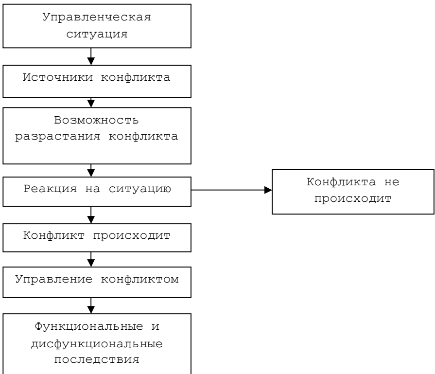
Рис. 2 Модель конфликта как процесса