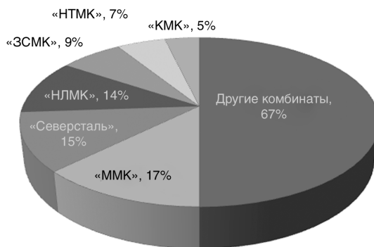
Рис. 2. Основные производители черной металлургии России

• ОАО «Евраз-Холдинг»: «НТМК» (Нижнетагильский металлургический комбинат), «ЗСМК» (Западно-Сибирский металлургический комбинат), «КМК» (Кузнецкий металлургический комбинат) (составлено автором на основе данных URL: http://www.evraz.com/ ).