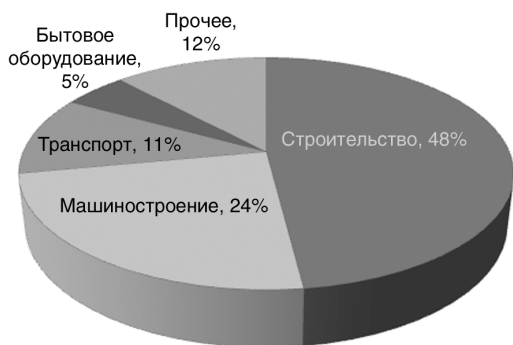
Рис. 1. Мировое потребление черной металлургии