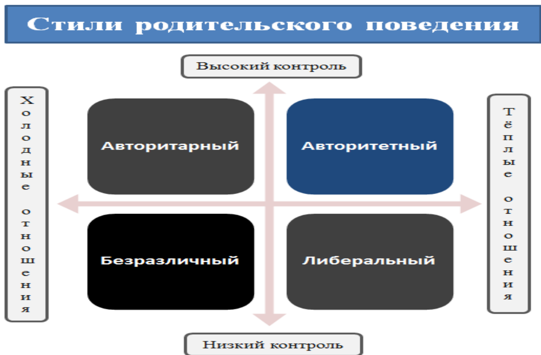
Рис. 1. Стили родительского поведения

Опираясь на исследования ученого Дайаны Бомринд, Грэйс Крайг дает характеристику классификации стилей родительского поведения, которая состоит из трех параметров. Для полного представления о стилях родительского поведения Крайг Г. предлагает дополнить таким стилем воспитания как «безразличный». Данная классификация представлена на рисунке 1.