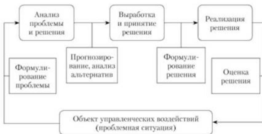
Место аналитика-консультанта в процессе выработки, принятия и реализации политического решения

Итак, в итоге разбора многочисленных вариантов определения политического анализа мы определяем его предметное поле. Прикладной политический анализ является политико-управленческой наукой, которая основывается на мультидисциплинарной базе и ориентирована на разработку общих принципов и множественных методов анализа, диагностики и прогнозирования проблемных ситуаций для подготовки рекомендаций к принятию публичных решений.