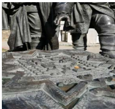
Б) План крепости