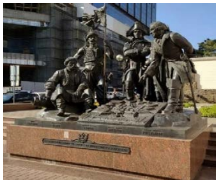
А) Общая композиция памятника