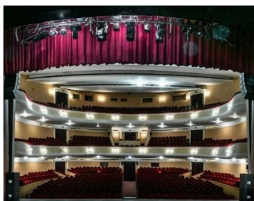
Б) внутреннее убранство театра