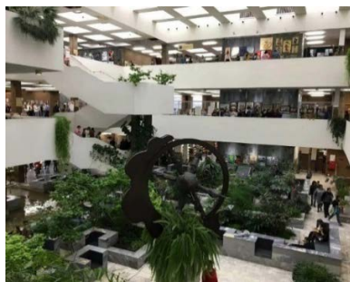
Б) внутренняя зона отдыха библиотеки