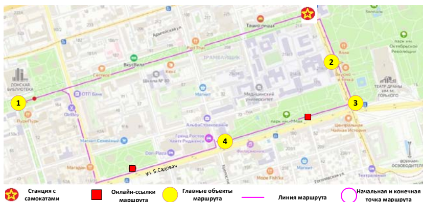
Рис. 1. Карта интерактивного туристического маршрута «Тебя окружают легенды Ростова»