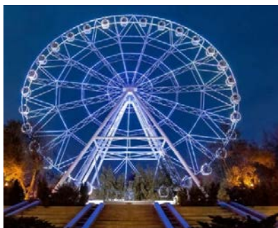
А) Ночная подсветка колеса «Одно небо»

Яркой достопримечательностью г. Ростова-на-Дону является колесо обозрения «Одно небо», которое было открыто в 2016 году и в этот же год завоевало профессиональную премию «Хрустальное колесо – 2016». Недавно после реконструкции оно было обновлено и радует всех своих посетителей от самых маленьких, до самых взрослых. Попасть на аттракцион могут 365 дней в году все желающие, в том числе маломобильные посетители, ведь здесь есть три вида кабинок: стандарт, комфорт и специальные (для маломобильных). Колесо обозрения «Одно небо» г. Ростова-на-Дону является третьим по высоте среди всех подобных аттракционов России после Сочи и Москвы, достигая в высоту 65 метров. (рис.3)