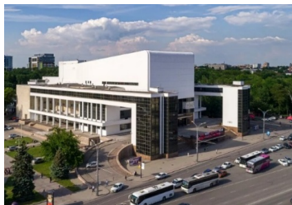
А) внешне стилизация здания театра под трактор

Здание театра было построено с 1930–1935 г. (архитекторы В.А. Шуко и В.Г. Гельфрейх) вмещало более 3 тыс. зрителей, включало несколько залов драмы и эстрады, а также библиотеку, музей, детские ясли и буфетные. Однако во время Великой Отечественной Войны здание сильно пострадало и при восстановлении в 1963 г. были уменьшены размеры театра, но пропорции здания сохранились. (рис. 4)